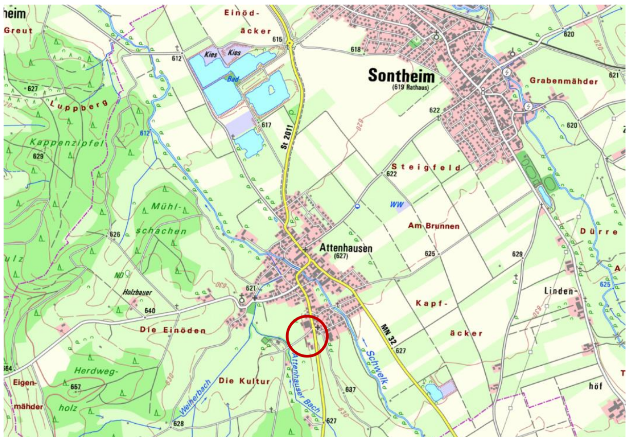
Abbildung 2: Lage des Änderungsbereichs; Quelle BayernAtlas, unmaßstäblich

Der Änderungsbereich des Flächennutzungsplans liegt auf der Gemarkung Sontheim und nimmt eine Fläche von insgesamt rund 1,4 ha ein. Dabei handelt es sich um eine Fläche am südwestlichen Ortsrand des Ortsteils Attenhausen.