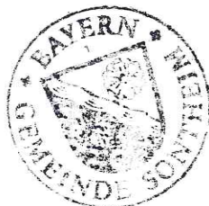
Harzenetter 2. Bürgermeister